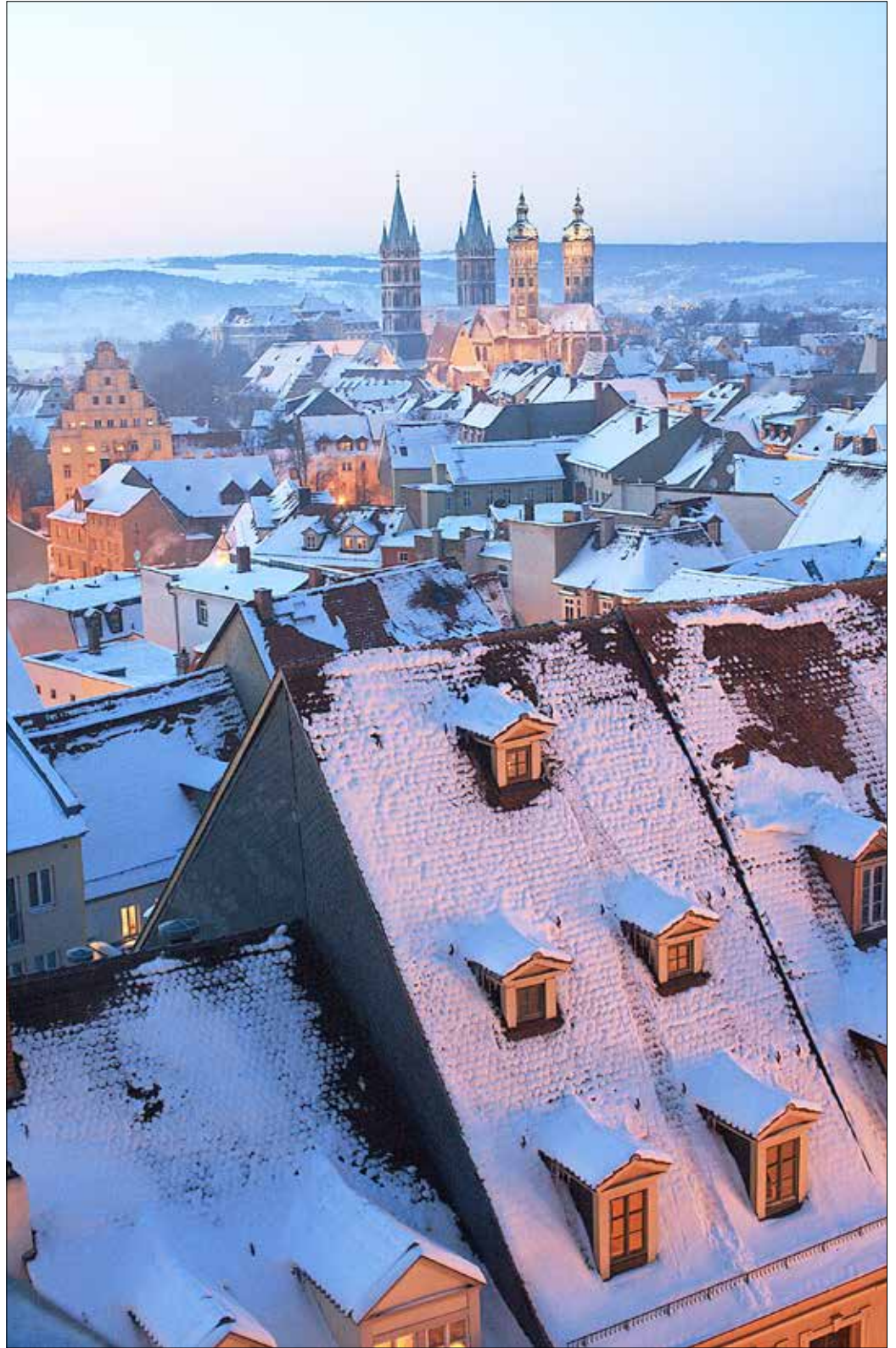
Blick vom Wenzelsturm