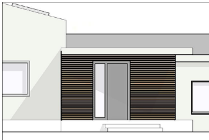
Der neue Eingangsbereich (Planungsskizze)

Für alle erforderlichen Planungen erklärten sich die Planungsbüros bereit, unentgeltlich zu arbeiten. Zwischenzeitlich liegen die Bauantragsunterlagen bei der Stadt zur Prüfung.