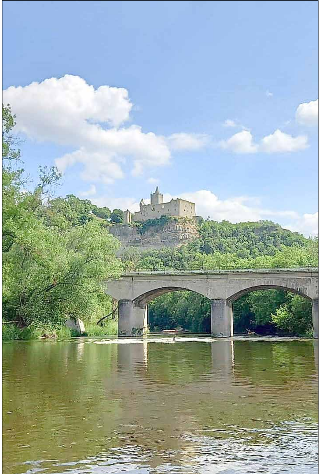
Blick von der Saale auf die Rudelsburg