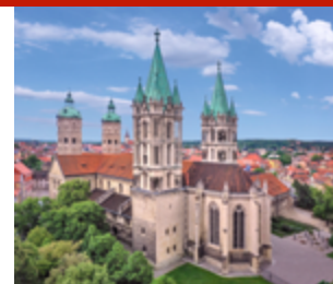
Eintritt inkl. Audioguide 3,00 - 9,50 € p. P. Eintritt inkl. Domführung 3,00 - 12,50 € p. P.

Domführungen | April bis Oktober Mo-Do | 10.00 und 14.00 Uhr Fr, Sa | 10.00, 14.00 und 16.00 Uhr So, kirchl. FT | 12.00, 14.00 und 16.00 Uhr