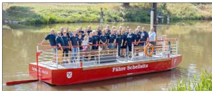
Fähre mit Fährverein Schellsitz

Um Anmeldung wird per Telefon unter 03445 273-102 oder per E-Mail unter sitzungsdienst@naumburg-stadt.de gebeten. Ziel des Projekts ist es, den Menschen in der Stadt Naumburgs Ortsteile näher zu bringen. Teilnehmende erfahren etwas über die Geschichte, Traditionen und das Vereinsleben des jeweiligen Dorfes. Darüber hinaus soll es Gespräche geben und die Möglichkeit Fragen zu stellen. Miteinander soll auf Defizite (z. B. Infrastruktur) geschaut und mögliche Änderungs- bzw. Lösungsvorschläge diskutiert werden. Außerdem sollen komplexere Aufträge vor Ort gesammelt werden, die später im Rathaus in die Bearbeitung gehen. Auf diese Weise soll die Zusammenarbeit mit den Verantwortlichen im Ort intensiviert werden.