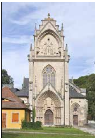
Klosterkirche in Schulpforte, Westfassade | Bildrechte: Stiftung Schulpforta

Anmeldungen zu den Führungen sind erwünscht, aber nicht erforderlich. Das Besucherzentrum der Stiftung Schulpforta befindet sich in der Schulstraße 22, 06628 Naumburg OT Schulpforte und ist telefonisch unter 034463 28115 oder per Mail an info@stiftung-schulpforta.de zu erreichen.