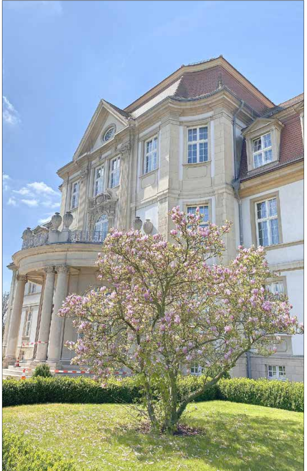
Das Oberlandesgericht Naumburg