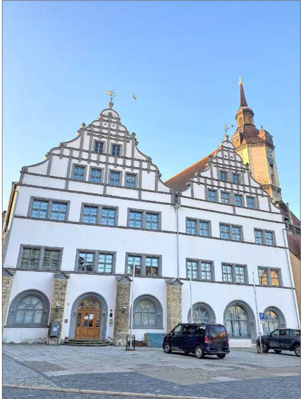
Das Amtsgericht am Naumburger Marktplatz.