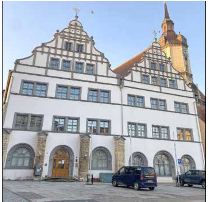
Amtsgericht Naumburg (Saale)

Die erforderliche Anzahl der Haupt- und Hilfsschöffen wird im Hinblick auf die Einwohnerzahl der Städte und Gemeinden im Amtsgerichtsbezirk bestimmt. Für die Stadt Naumburg sind mindestens 30 Personen zu benennen. Das Ehrenamt als Schöffe kann nur ausüben, wer die deutsche Staatsangehörigkeit besitzt. Bewerben können sich Personen, die mit Beginn der Amtsperiode das 25. Lebensjahr vollendet haben, nicht älter als 69 Jahre sind und in der Gemeinde ihren Wohnsitz haben.