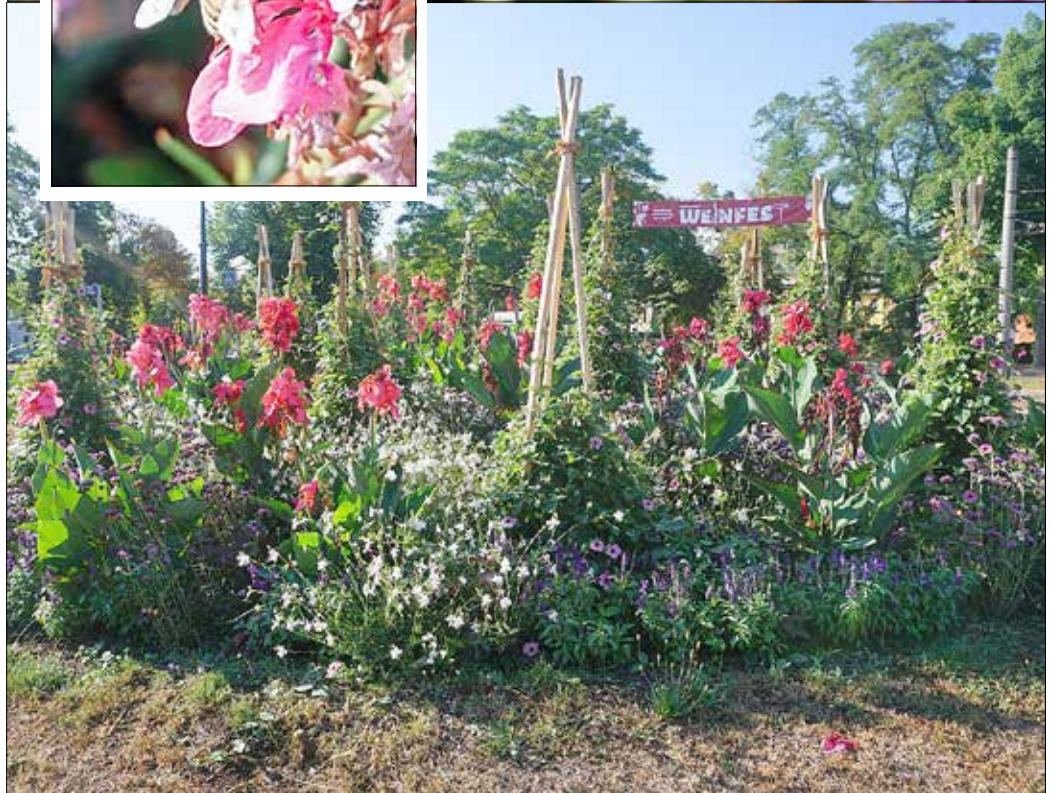
Die Bepflanzung am Heinrich-von-Stephan-Platz ist derzeit ein wahres Paradies für Insekten