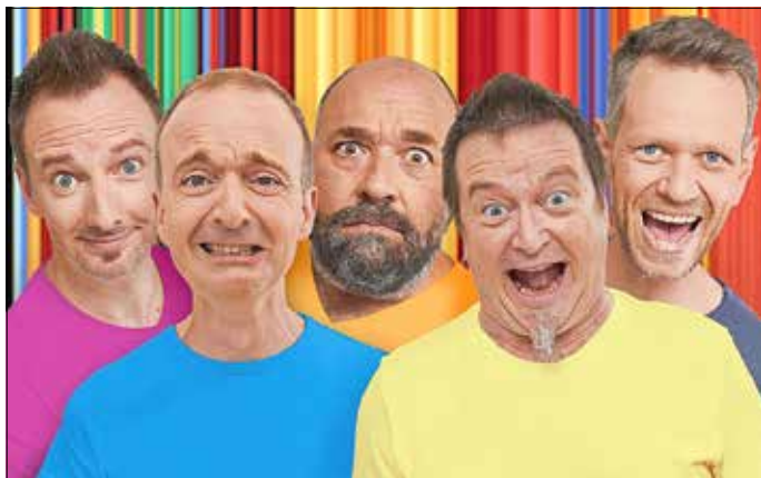
Die Band „fünf“