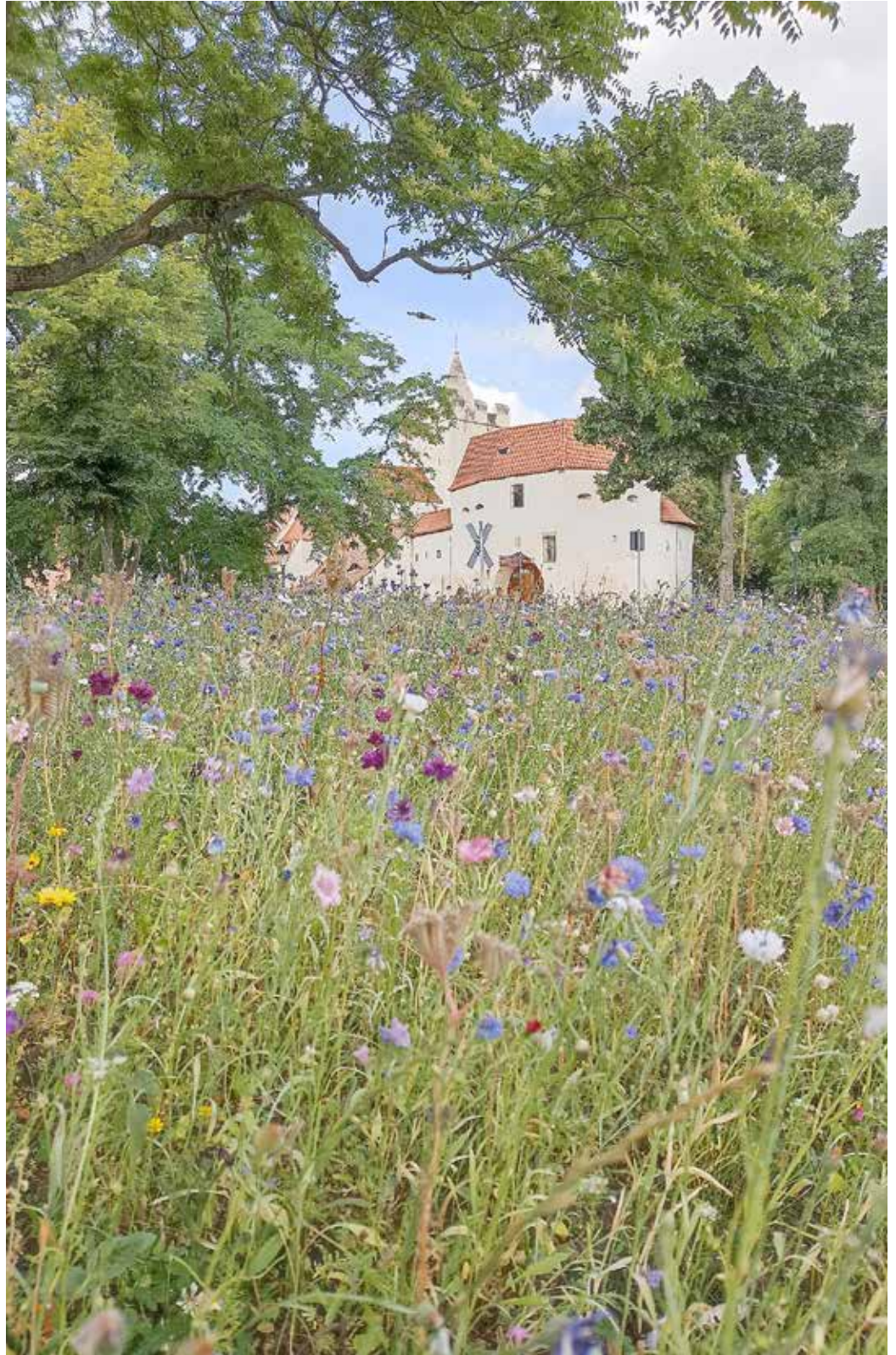
Blühstreifen am Marienring