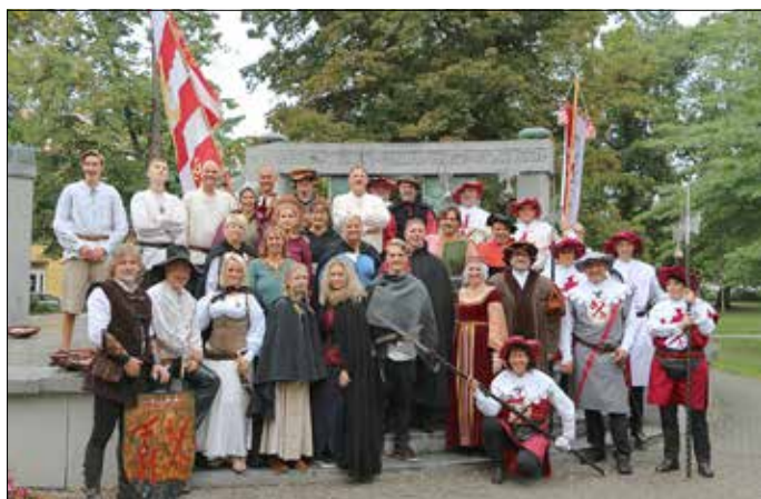
Naumburger in Tabor im Jahr 2017

Naumburg ist Mitglied in der Vereinigung der Städte mit hussitischer Geschichte und Tradition, die auf Initiative der Städte Neunburg vorm Wald und Tabor im Jahr 1998 gegründet wurde. Die Vereinigung fördert lebendige Begegnungen zwischen Deutschen und Tschechen und unterstützt ihr gegenseitiges Kennenlernen.