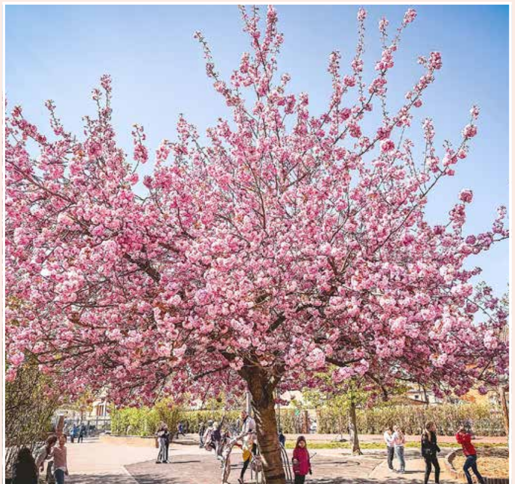
Schulhof der Uta-Schule