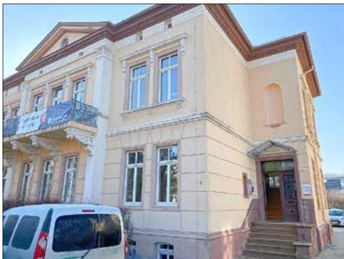
Das Impfzentrum Naumburg

Seit dem 28. Februar 2022 haben sich die Öffnungszeiten der Impfstellen des Burgenlandkreises in Naumburg, Bad Bibra, Zeitz und Zorbau geändert. Es ist nun von Mittwoch bis Samstag möglich, sich in der Zeit von 11:00 bis 18:00 Uhr impfen zu lassen. Grund für die Verkürzung der Öffnungszeiten ist der Rückgang der Impfwilligen an allen Standorten. In den vier Impfstellen werden Erst-, Zweit- und Auffrischimpfungen ab einem Alter von fünf Jahren angeboten. Eine vorherige Terminvergabe ist nicht notwendig.