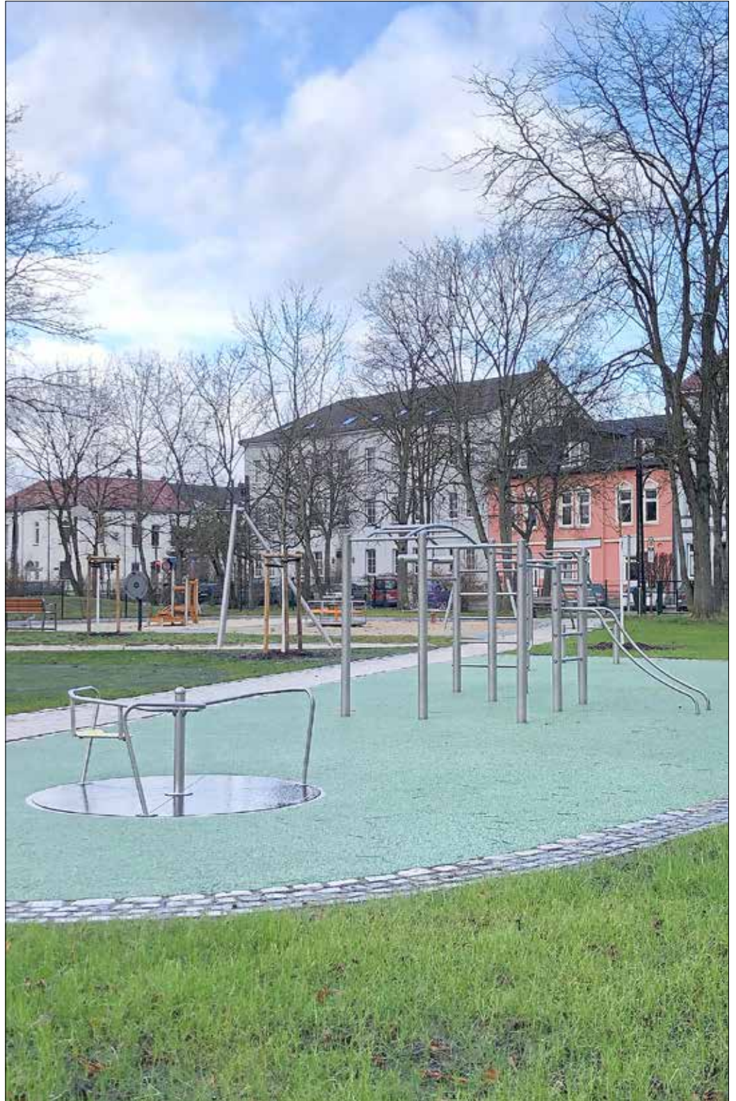
Neugestaltung des Jägerspielplatzes - Lesen Sie mehr auf Seite 8.