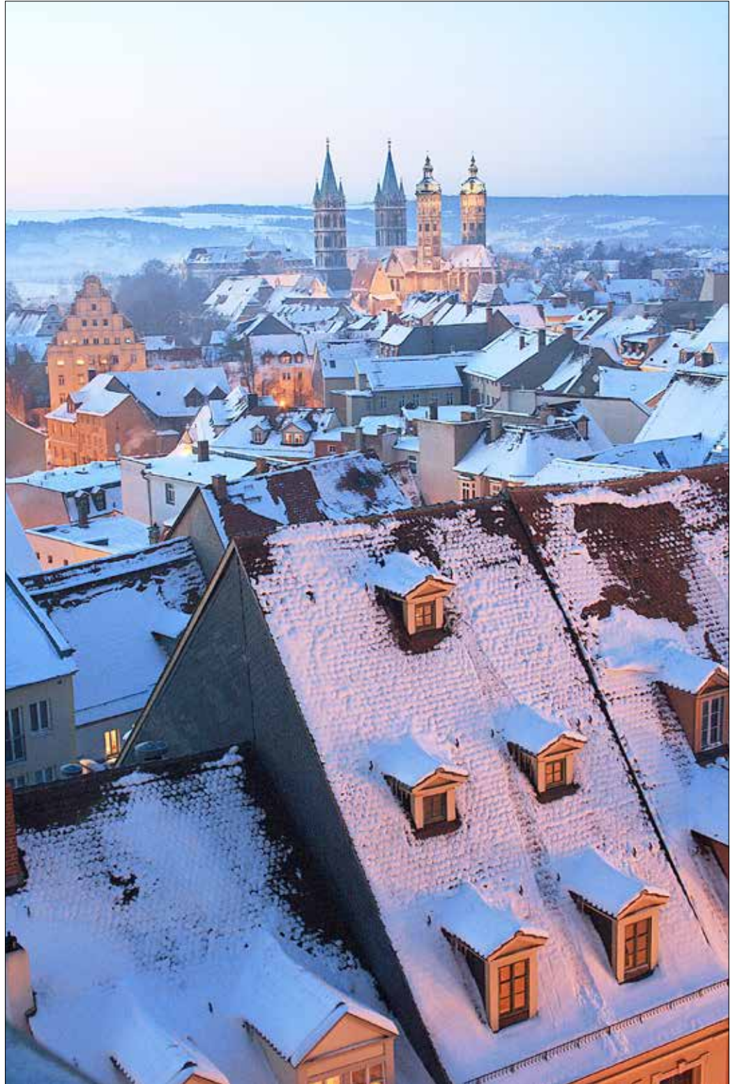
Blick vom Wenzelsturm