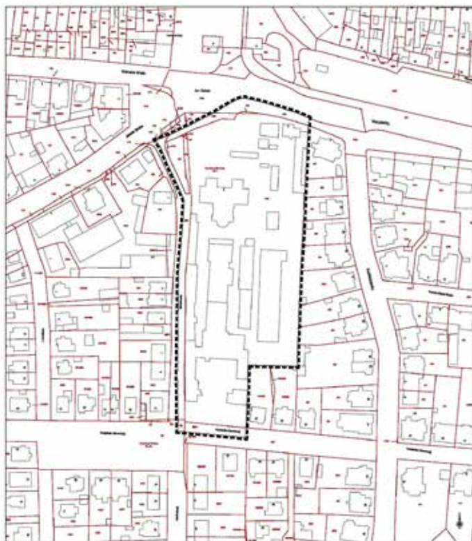
Abbildung 1: Räumlicher Geltungsbereich des Bebauungsplans Nr. 30