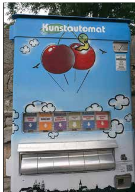
Der Kunstautomat - eine der vielen Aktionen des Pop-up Festivals

Informationen zum Projekt STIMULART gibt es beim Projektmanagement unter 03445 273107 oder stimulart@naumburg-stadt.de .