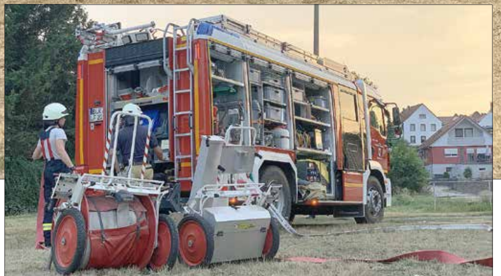
Löschfahrzeug der Freiwilligen Feuerwehr Naumburg. Mehr zum Thema Feuerwehr auf Seite 7.