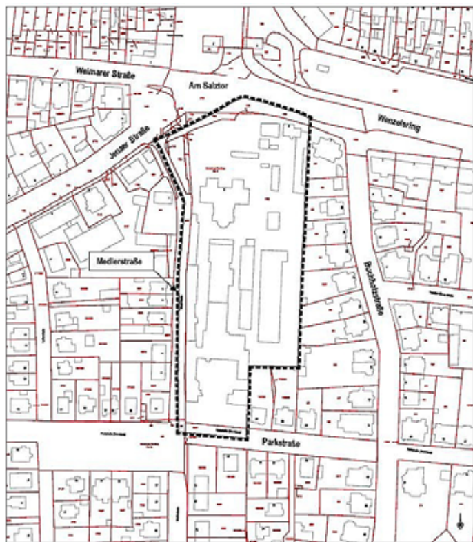
Abbildung 1: Räumlicher Geltungsbereich des Bebauungsplans Nr. 30

Die räumliche Lage und die Abgrenzung des Plangebietes sind aus dem beigefügten Lageplan (Abbildung 1) ersichtlich.