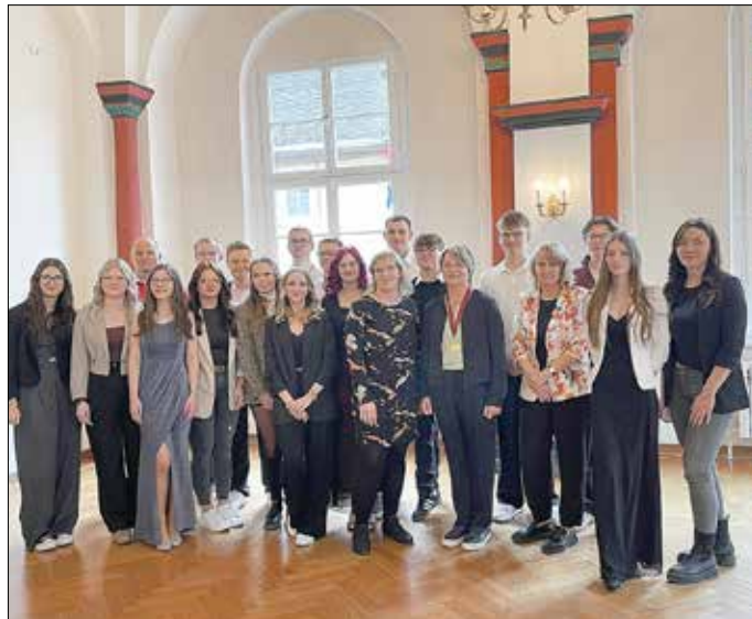
Die Absolventinnen und Absolventen lernen bei den Verwaltungen der Kommunen Zeititz, Weißenfels, Hohenmölsen, Bad

Im kleinen Ratskellersaal der Stadt Naumburg (Saale) konnten kürzlich zahlreiche Auszubildende der Verwaltungsfachangestellten ihren erfolgreichen Berufsschulabschluss feiern. Die angehenden Verwaltungspromis haben in den vergangenen Jahren umfassende Kenntnisse in Verwaltungsrecht, kommunaler Organisation und bürgernaher Dienstleistung erworben und damit eine wichtige Grundlage für ihre zukünftige Tätigkeit geschaffen.