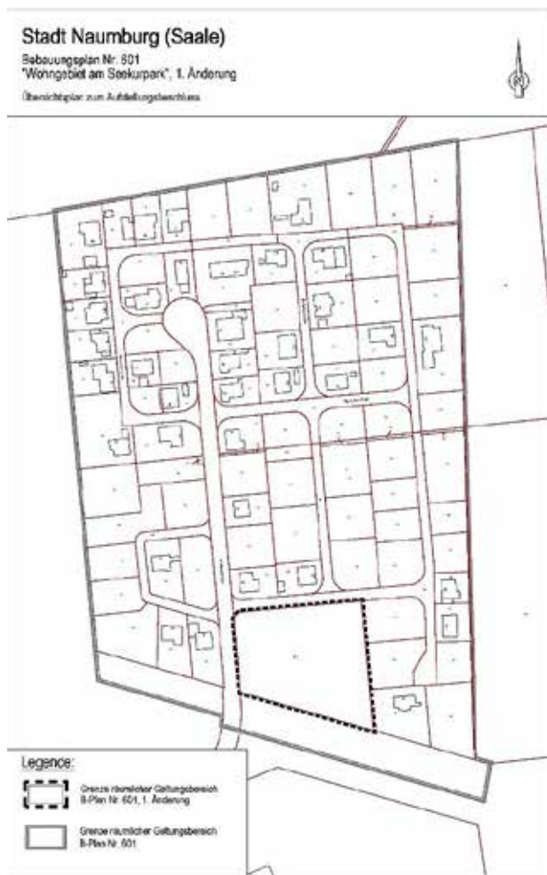
Abbildung 1: Übersichtsplan zur Lage des Plangebietes innerhalb des Wohngebietes am Seekurpark im Ortsteil Bad Kösen

Die in den §§ 44 und 215 BauGB festgelegten Fristen beginnen mit dieser Bekanntmachung.