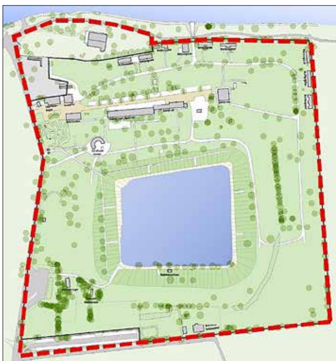
Abbildung 1: Abgrenzung des räumlichen Geltungsbereichs

Das Plangebiet umfasst die Flurstücke 16, 17, 18, 19 und 23 teilw. der Gemarkung Naumburg, Flur 9, mit einer Größe von insgesamt rund 14 ha, die in der Summe einen bedeutenden Naherholungsstandort bilden (siehe Abbildung 1).