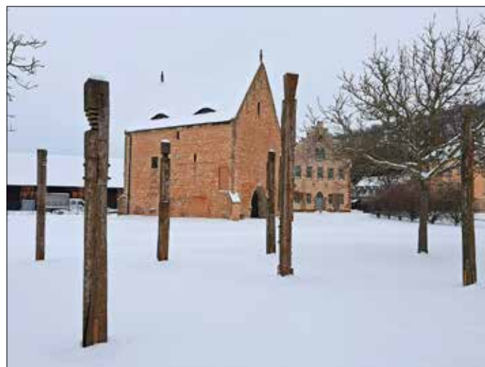
Das Gotische und das Neogotische Haus