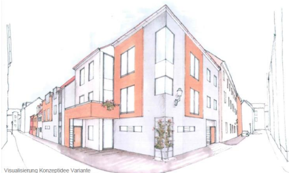
Visualisierung Konzeptidee Variante Bebauung Mühlgasse 1 - 4 / Eckbereich Mariengasse 9

Am Standort besteht im Zuge der Ersatzneubauung das Ziel der Verbesserung der Belichtungs- und Belüftungssituation. Vorstellbar ist insbesondere die Anlage von kleineren Gartenflächen oder Beetbepflanzungen im Hofbereich.