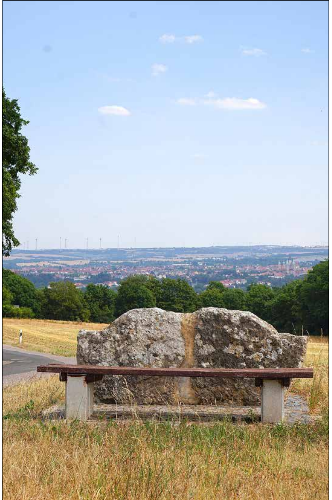
Blick von der Hermannsbank an der Straße nach Großwilsdorf