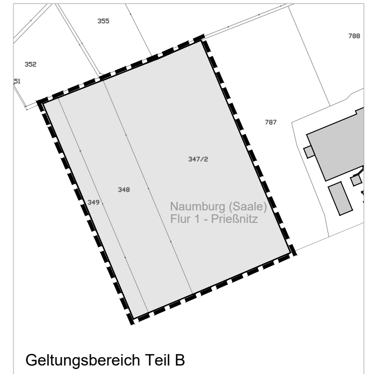
Geltungsbereich Teil B