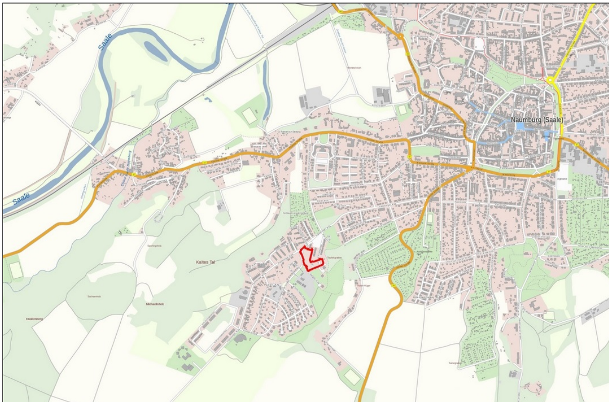
Abb. 1: Lage des Plangebiets im Stadtgebiet