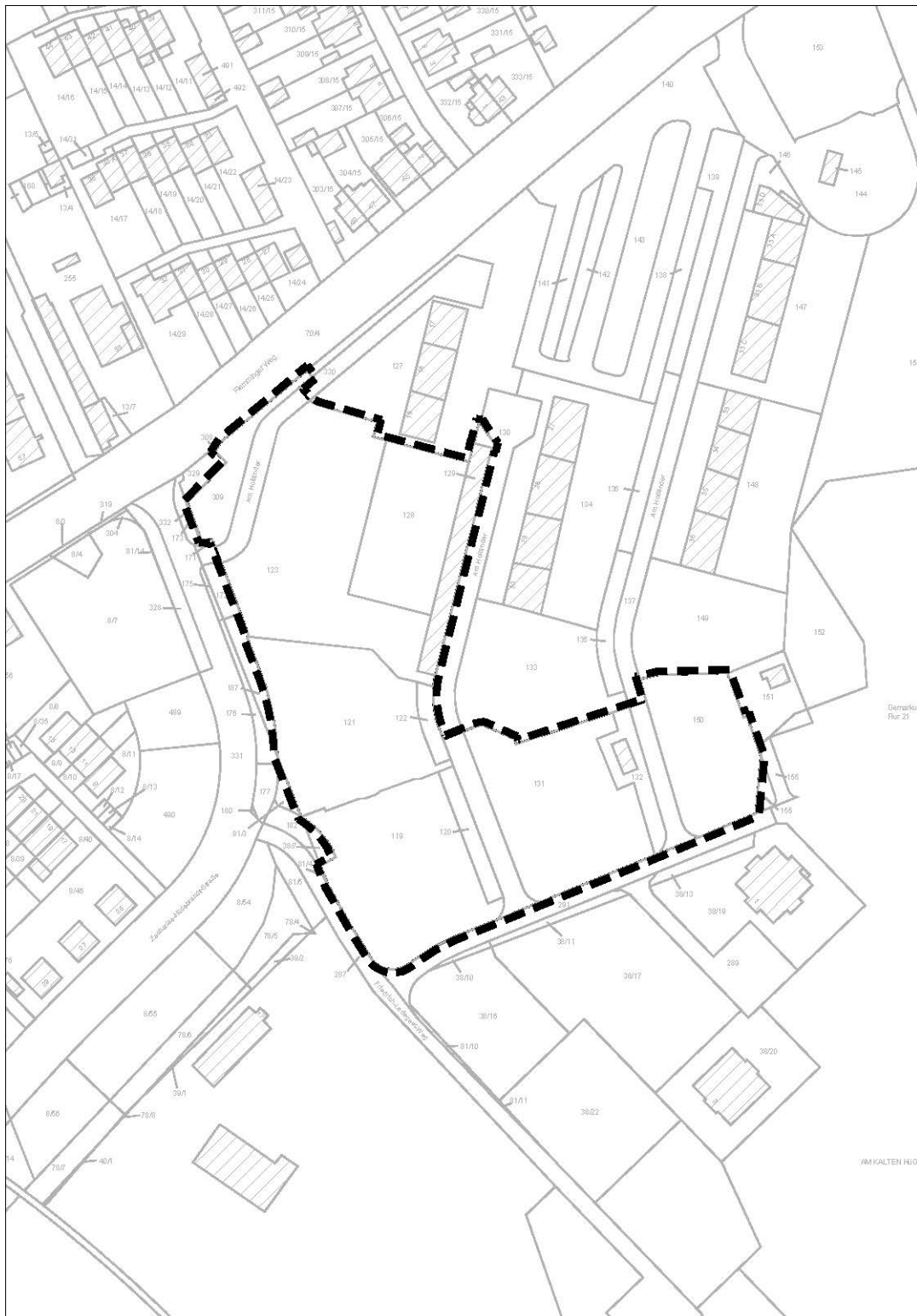
Abb. 2: Lage des Plangebiets im Ortsteil (Allgemeines Liegenschaftskataster ALK mit Darstellung des Geltungsbereichs)