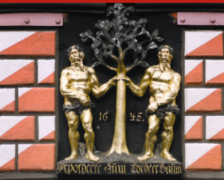
📍📞📅 Auch als Audioguide-Tour in der Tourist-Information buchbar

Führung durch 1.000 Jahre Stadtgeschichte mit Präsentation liebenswerter Details.