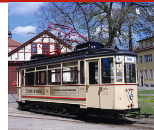
📞 Sonderfahrten Tel. 03445 703002

Seit 2007 ist die "Wilde Zicke" wieder täglich in Betrieb und pendelt mit Fahrzeugen aus den 1950er und 1960er Jahren zwischen Hauptbahnhof und Innenstadt. Die Führung durch das historische Depotgebäude der Naumburger Straßenbahn aus dem 19. Jahrhundert bietet neben einem Rundgang viel Wissenswertes über die Straßengeschichte und über die eingesetzten historischen Fahrzeuge.