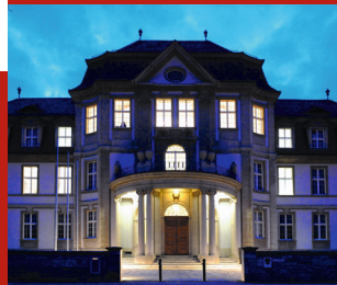
📍📞📅 Kartenvorverkauf empfohlen

Spektakuläre Kriminalfälle, historische Rechtsbräuche und Methoden der Rechtsfindung sowie drastische Strafen aus dem Mittelalter werden Sie zum Staunen und Gruseln bringen. Ein hochprozentiger »Blutstropfen« sorgt für die Beruhigung der Gemüter. Durch gespielte Szenen wird die Tour zu einem theatralischen Spaziergang.