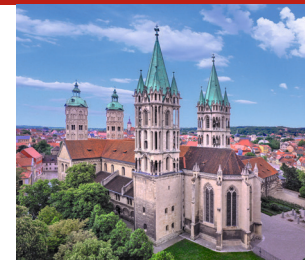
📍📞📅 Eintritt 3,00 € - 9,50 € p. P., Inkl. Domführung 3,00 € - 12,50 € p. P.