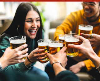
📍📞 Kartenvorverkauf empfohlen