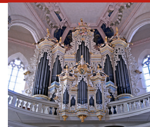
📞 Weitere Konzertangebote: www.hildebrandt-orgel.de

Bachs Beste: Die Hildebrandt-Organ in St. Wenzel gehört zu den bedeutendsten Schöpfungen des spätbarocken Organbaus. Die Orgelpräsentation nach den Mittagskonzerten ermöglicht Blicke auf die imposante Balganlage und den historischen Spieltisch mit den originalen Klaviaturen und Registerzügen von 1746, an dem Johann Sebastian Bach die Orgelprobe vollzogen hat.